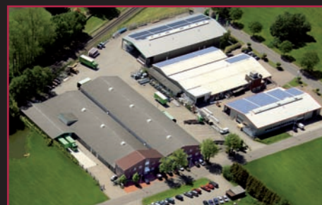
WERK GROWE Barßel