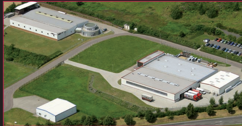
WERK ROLTEX Mügeln

Die GROWE-Gruppe steht für Leistungsstärke und Kompetenz - darauf können Sie sich verlassen!