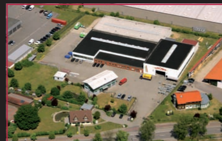
WERK GROWE Wittstock